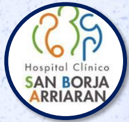
Hospital San Borja Arriarán

La primera etapa comenzó el 19 de octubre 2022 , para vacunación post-exposición en 2 centros de vacunación de la región metropolitana :